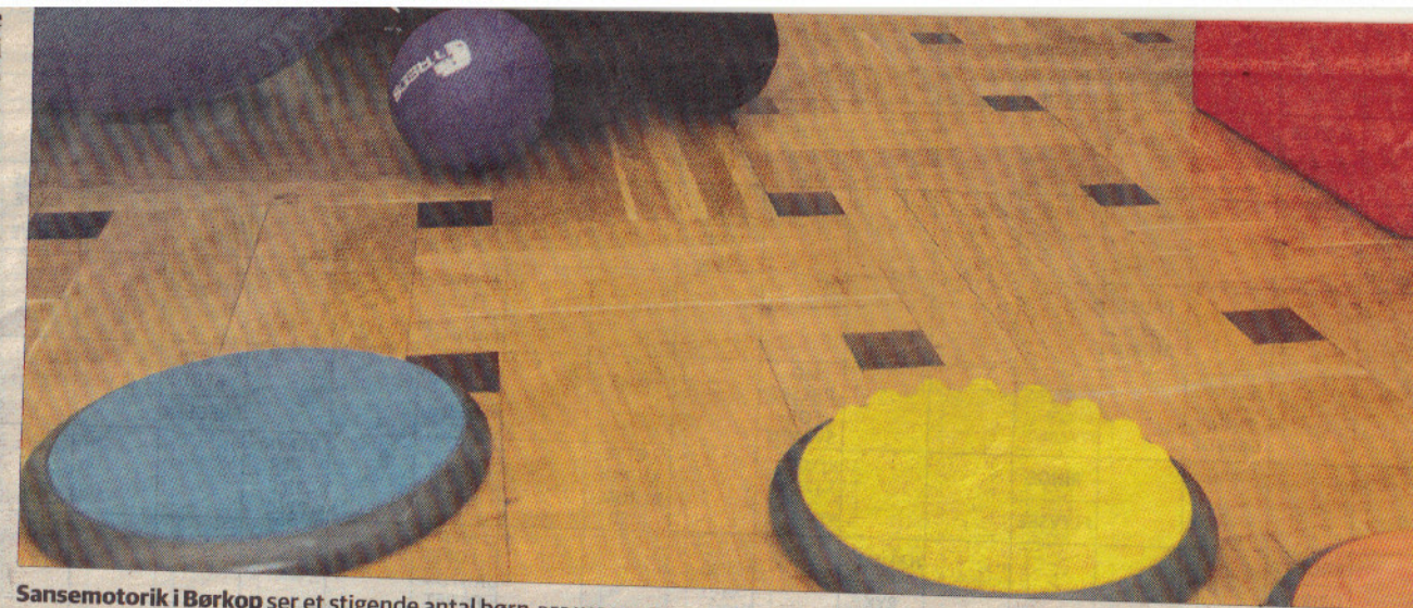
Sansemotorik i Børkop ser et stigende antal børn, der har forskellige problemer eller udfordringer, fordi de har brugt kroppen for lidt og fået dårlig motorik.

fundamentet for al læring. Børn lærer med kroppen, og på et tidspunkt vil der sandsynligvis komme en konsekvens af, at kroppen og hjernen ikke er blevet brugt, hvis barnet har siddet for meget med stillesiddende aktiviteter, forklarer motorikvejlederen.